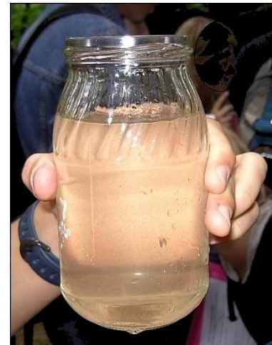
Untersuchung von Wasserproben