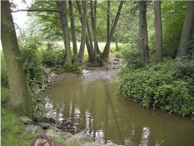
Bestimmung und Skizzieren von Flussläufen