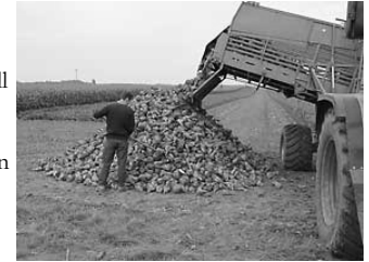
Abbildung 2: Miete