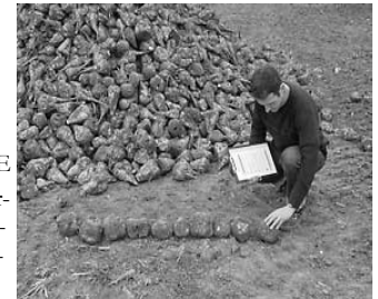
Abbildung 4: 10 Rüben

Skizze nicht maßstäblich 1 Einheit entspricht 1 Meter